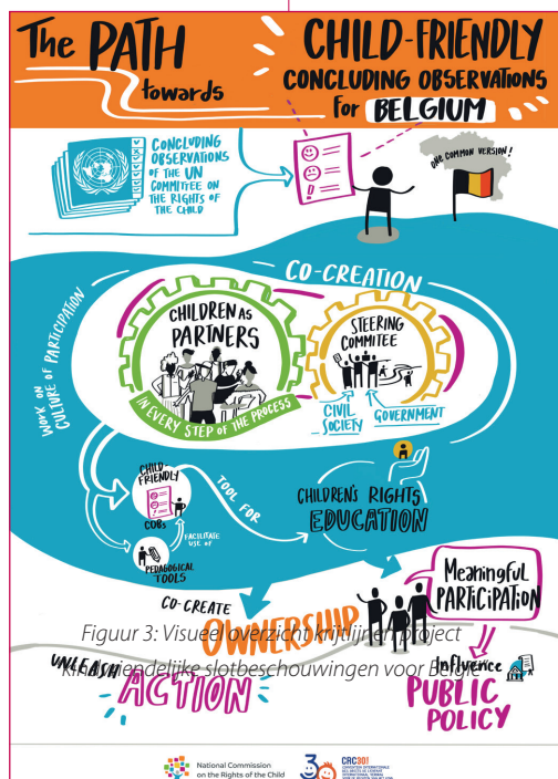
Figuur 3: Visueel overzicht van het huidige project

De krijtlijnen van dit project zijn de volgende: